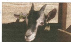
L'année 2015 s'achève sur une nouvelle très bonne année pour la pépinière Chèvres des Savoie.

Plus d'infos sur www.association-chevre-savoie.fr ou la page Facebook de l'association.