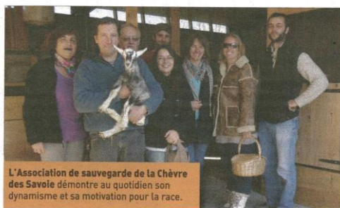
L'Association de sauvegarde de la Chèvre des Savoie démontre au quotidien son dynamisme et sa motivation pour la race.