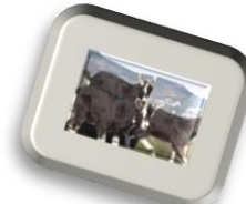
Noire à barrettes...