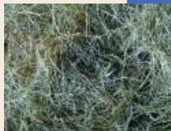
Bon foin de graminée