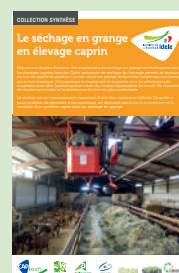
Guide séchage en grange et module web

Pour du séchage en botte, il faudra bien anticiper les besoins de manutentions des bottes (zone prévue, temps de travail) pour du séchage en botte.