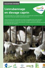
Guide enrubannage et modules web

L'enrubannage demande peu d'investissement « en dur » et peut être fait de manière opportuniste. Son inconvénient, c'est son coût de production plus élevé. D'un point de vue rationnement, il faudra veiller à la qualité sanitaire de la botte pour éviter les ennuis : on élimine les morceaux de moisi, une botte ouverte est consommée en 2-3 jours, un fourrage sec en complément sécurise la ration.